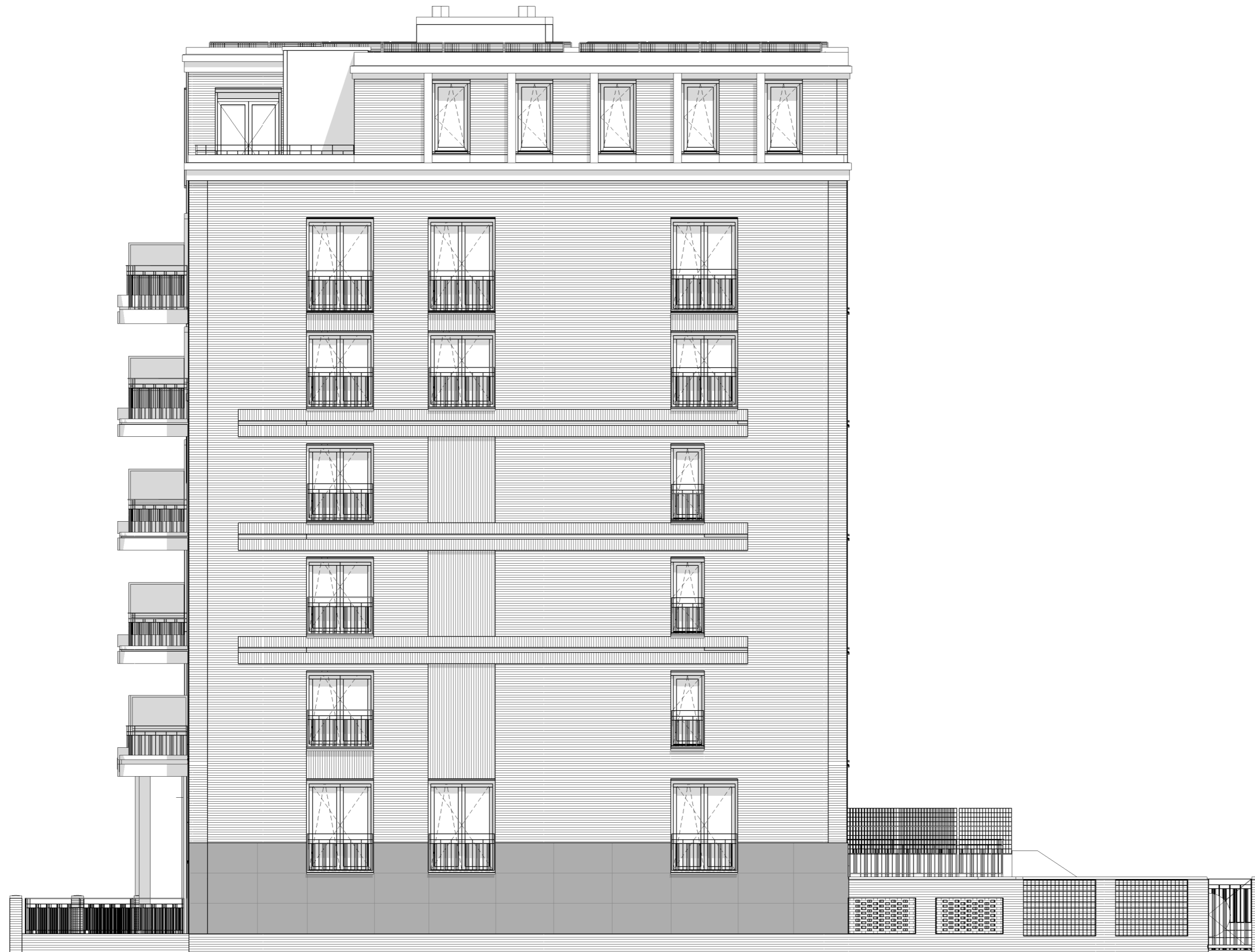
Rechtergevel / Zuidoostgevel 1 : 100